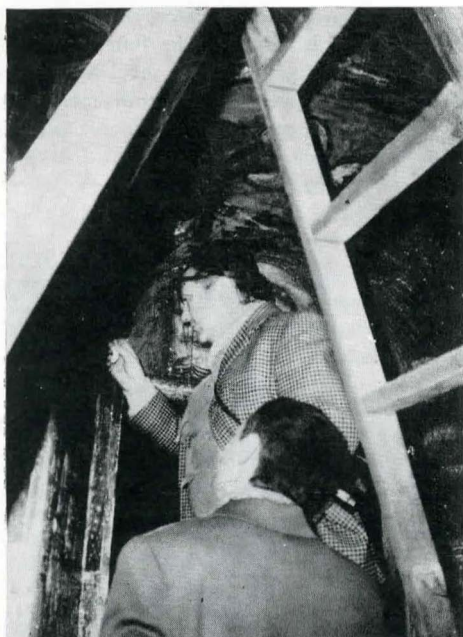
Fig. 1. P. Mora, la mănăstirea Humor.

Atente observații la fața locului, coroborate cu analize minuțioase de laborator, au stabilit natura pigmentilor și a lianților și au dus la concluzia că aceste picturi au fost realizate într-o tehnică mixtă: începute în frescă, ele au fost terminate „a secco”. Alături de acestea au fost studiate unele modificări ale culorilor sub acțiunea agenților naturali, cauzele apariției umezeții pe zidurile de la Voroneț și Moldovița, precum și diverse variante de protecție a picturilor cu ajutorul panourilor mobile.